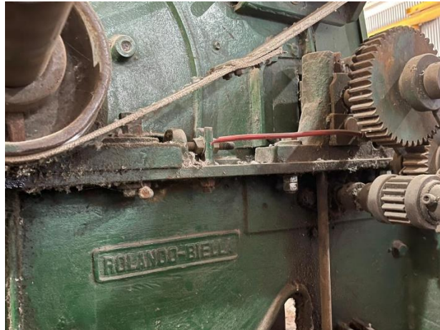
Imagen de la desfibadora y ficha técnica

Oreste Rolando Officine meccaniche tessili Huella chiavazza N°1129/274 Anno 1952