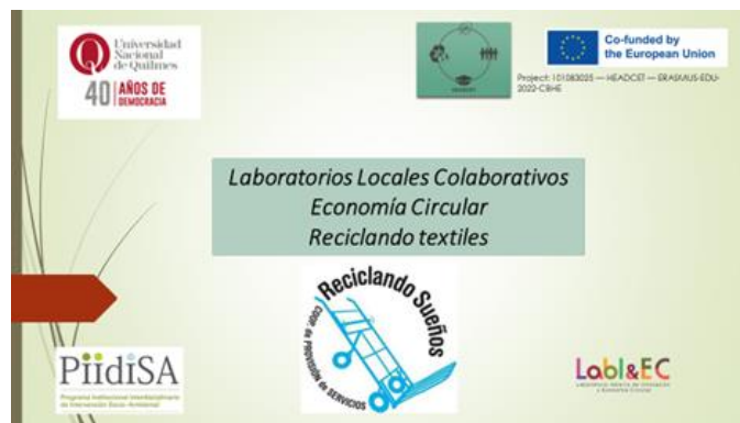
Imagen convocatoria a la reunión

La reunión estuvo convocada no sólo para avanzar en la interrelación entre la cooperativa y la UNQ sino, además, para preparar otra con los diversos actores que participan en esta actividad.